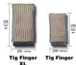
Tig Finger XL